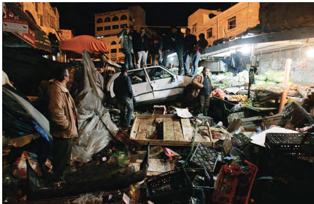
שווק הירקות ברמאללה לאחר פעולת המסתערבים, 4.1.07.

ב-21.1.07 פנה בצלם לפרקליט הצבאי הראשי בדרישה כי יורה על פתיחה בחקירה של האירוע. במכתבו ציין בצלם כי הפגיעות הרבות בתושבים וההרס הרב שנגרם לרכוש מעלים חשד כבד כי הצבא פעל בניגוד לעקרון ההבחנה ולעקרון המידתיות שבמשפט ההומניטארי הבינלאומי. ספק אם היתרון הצבאי ממעצרו של אדם אחד עולה על הפגיעה הצפויה באזרחים, כפי שקרה במקרה זה. כן ציין בצלם כי פעולת מסתערבים בתוך אוכלוסייה אזרחית, הנעשית בשעות אחר הצהריים במרכז העיר, מסכנת עוברי אורח מבלי שידעו כלל שהם נתונים בסכנה. העובדה שזמן כה קצר לאחר שהמסתערבים נחשפו הגיעו למקום כוחות חילוץ מצביעה על כך שמתכנני המבצע צפו אפשרות כזו ומשכך היה עליהם לצפות אף את הסיכון החמור לפגיעה באזרחים.