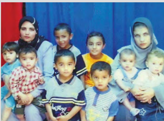
משפחת א-זעאנין (ריאזי שני משמאל בשורה האחורית).