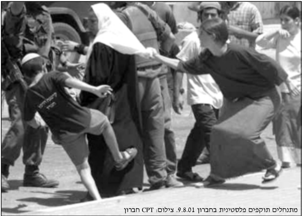
מתנחלים תוקפים פלסטינית בחברון 9.8.01.

אני חי עם אישתי ועשרת ילדי בבית ישן המכיל כמה חדרים. כל בני המשפחה גרים בשני חדרים בלבד. יתר החדרים מחכים לאישור מהרשויות הישראליות, שמנעו מהוועדה הפלסטינית לשיקום העיר העתיקה לשפץ את הבית. הסיבה לכך היא קירבת הבית להתנחלות אברהם אבינו. המטבח בבית אינו שלם וללא דלת וכך גם השירותים. מול ביתנו ומתחתיו ישנה עמדה צבאית ישראלית, המוצבת על