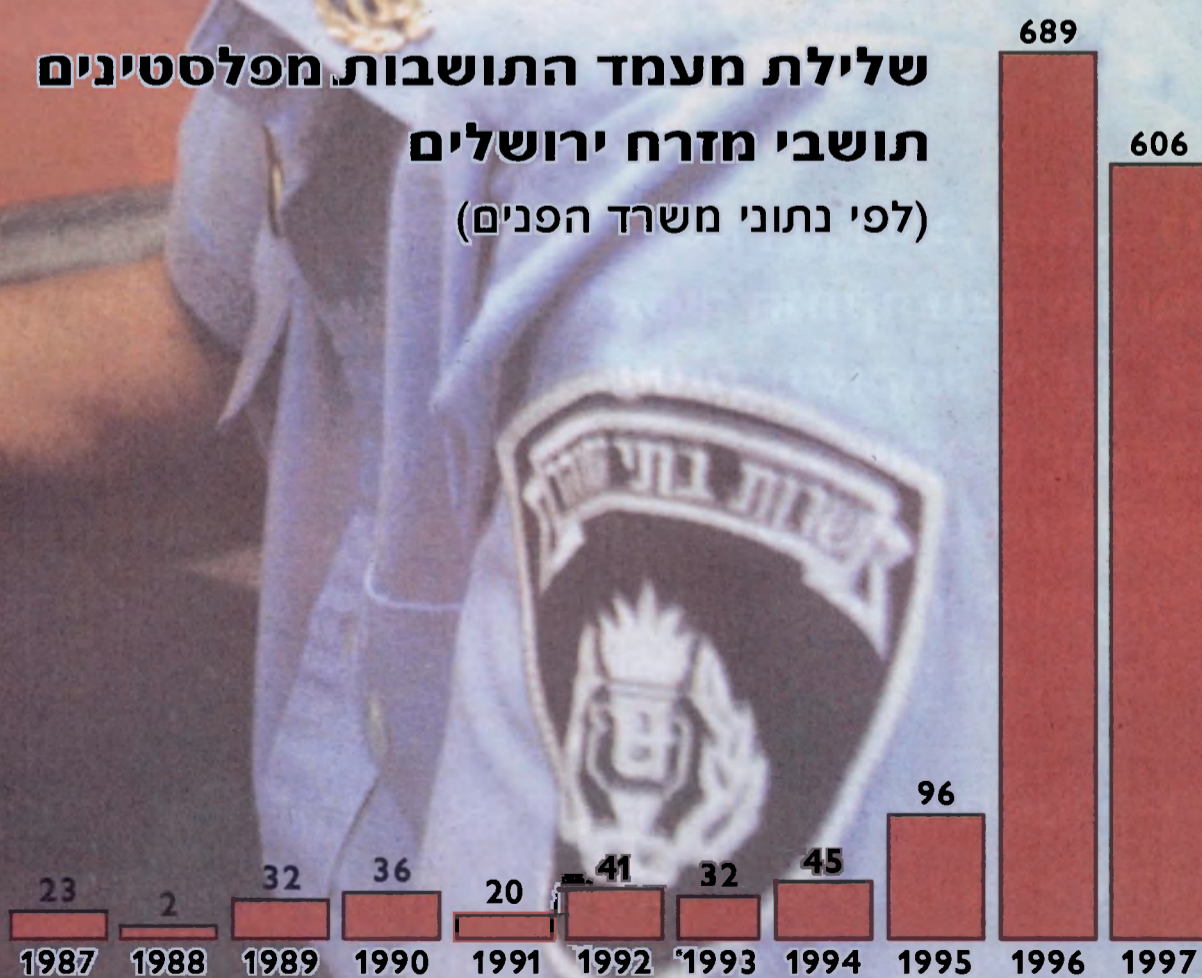
שלילת מעמד התושבות מפלסטינים תושבי מזרח ירושלים (לפי נתוני משרד הפנים)

בשנים האחרונות שללה ישראל את מעמד התושבות של אלפי פלסטינים שלא שהו בעיר תקופה מסוימת, תוך שימוש ב"חוק הכניסה לישראל", ודרשה מהם לעזוב את ירושלים תוך 15 יום.