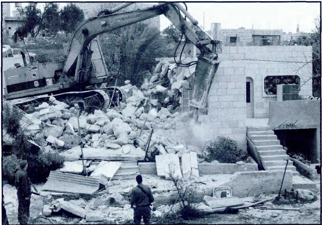
הריסת בית משפחת א-שריף בבית-חנינה ב-20.3.96.

בפסק-הדין העניק בית-המשפט העליון אצטלה חוקית לצעד של הריסת בתים. בכך גילה בית-המשפט עקביות להחלטותיו בעשרות מקרים אחרים לאורך השנים, בהם דחה עתירות של פלסטינים כנגד הריסת בתיהם. בפסיקותיו אלה משמש בית-המשפט למעשה כחותמת גומי לפעולות הממשלה בשטחים, ואינו עומד על המשמר מול פגיעה בזכויות האדם ובשלטון החוק.