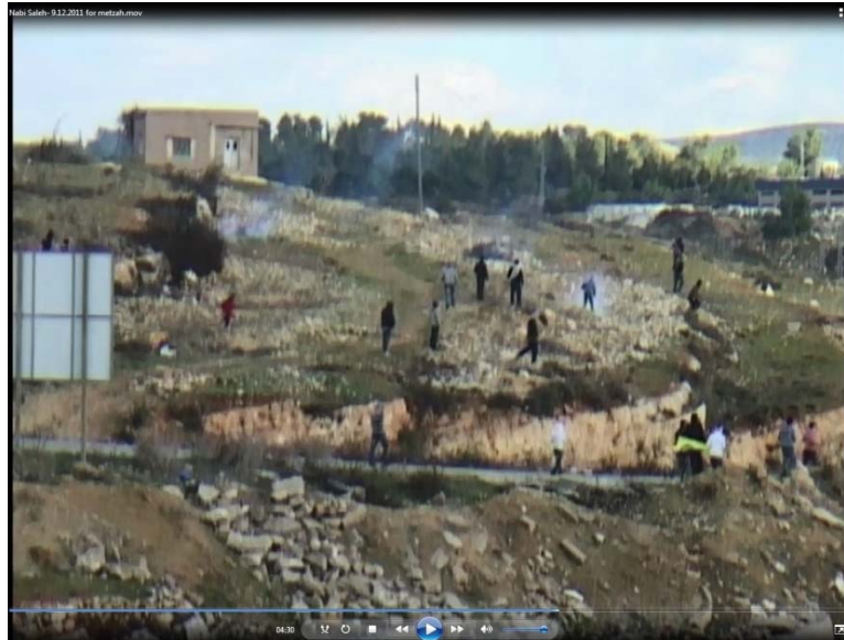
צילום מסך מתוך תיעוד הוידאו של דוד ריב, 04: 30

40. בזמן שהשופל פינה את מחסום האבנים, ירד הסמג"ד שגי'א מהגי'פ וירה כמה רימוני גז לכיוון המפגינים. כעבור זמן קצר הצטרף א' וירה אף הוא לעבר המפגינים. לאחר שהסמג"ד עזב את המקום, שב א' וירה גז מדמיע לכיוון המפגינים ואז הצטרף לחבריו בגי'פ, שנותר לבדו בשטח.