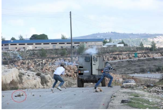
IMG_7556-IMG_7560 רצף התמונות

34. גם מההדמיה שיצר סא"ל נ' ובה ביקש להתחקות אחר תנועתו של תמימי לאורך האירוע, עולה בבירור שתמימי שמר בעקביות על מיקומו בחלק השמאלי של הכביש (מנקודת מבטו) ולא רץ ושינה את מיקומו תדיר כפי שטען נ'. אדרבא, על פי ההדמיה ניכר כי תמימי היה לאורך כל שלבי האירוע בטווח ראייה דרך חלונות הגיפ. מאחר שא' עצמו העיד כי הביט מבעד לחלונות הגיפ טרם ביצע הירי, המסקנה המתבקשת היא כי יכול היה לראות את תמימי.