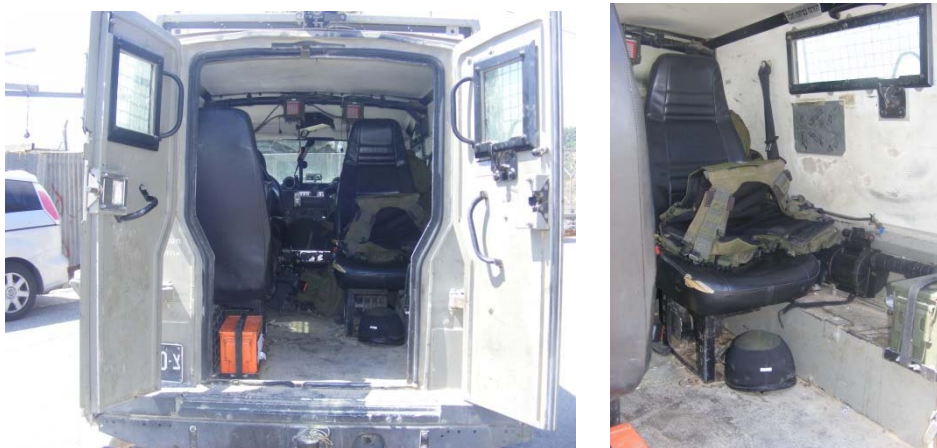
מושבו של א', תמונות DSCF500 ו-DSCF499, מתוך צילומי מבנה הגייפ שצולמו במהלך ביצוע שחזור האירוע ושימשו גם לצורך הכנת חוות הדעת

29. חוות הדעת מתעלמת משדה הראיה הנשקף מחלונות הגייפ - חוות הדעת עוסקת רבות בשאלת מפתח דלת הגייפ, אולם מתעלמת מכך שגם מתוך הגייפ ניתן להבחין במתרחש מחוצה לו באמצעות החלונות הממוקמים בגובה עיניו של החייל היושב בגבו לכיוון הנסיעה, ואשר נועדו למטרה זו ממש. במקרה דנן היתה לא' זווית ראייה טובה הן דרך החלון שבצדו הימני של הגייפ (שפנה לתמימי ולמפגין הנוסף בזמן סיבוב הגייפ), והן דרך שני החלונות שבדלתות האחוריות של הגייפ. מסיבה לא ברורה, אין בחוות הדעת כל התייחסות לכך ולא מוסקות המסקנות המתבקשות בנדון.