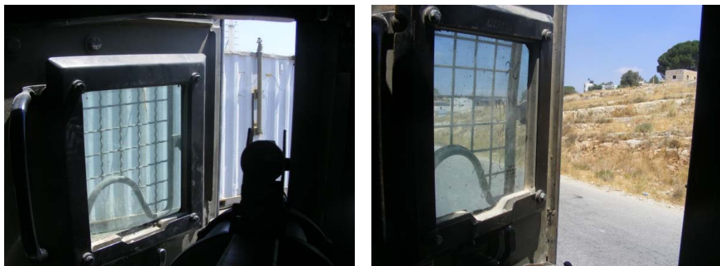
תמונות DSCF515 (מימין) ו-DSCF506 מתוך צילומי מבנה הגייפ שצולמו במהלך ביצוע שחזור האירוע ושימשו גם לצורך הכנת חוות הדעת

31. חוות הדעת מתעלמת משינוי שדה הראיה המתלווה לשינוי במפתח הדלת - ברצף התמונות ניתן לראות את עצירת הגייפ ולאחריה את פתיחת דלת הגייפ (בתמונה IMG_7556), אך עד התמונה שבה נראה הירי הקטלני (IMG_7560) ניתן להבחין בנקל שמפתח הדלת גדל בהדרגה. הגם שאין עוררין כי יש לכך השפעה של ממש על זווית הראיה של א', באופן תמוה גם לכך אין כל התייחסות בחוות הדעת.