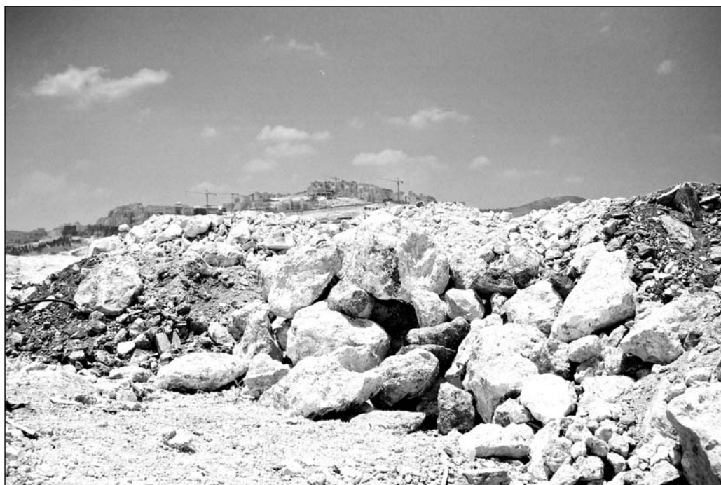
חסימה בדרך המחברת בין נועמאן לאום טובא - ברקע ההתנחלות הר חומה

אני מתכוון להמשיך לשלם את הקנס למרות שאני יודע שהסיכוי לקבל היתר בנייה נמוך ביותר. אני מקווה שאם אשלם את הקנס ובמקביל אטפל בעניין ההיתר, אולי זה יסתדר. אני מוכן ללוות כסף מחברים ומקרובי משפחה, אם אצטרך, כדי לעמוד בתשלומים. אני חושב כל הזמן איך להגדיל