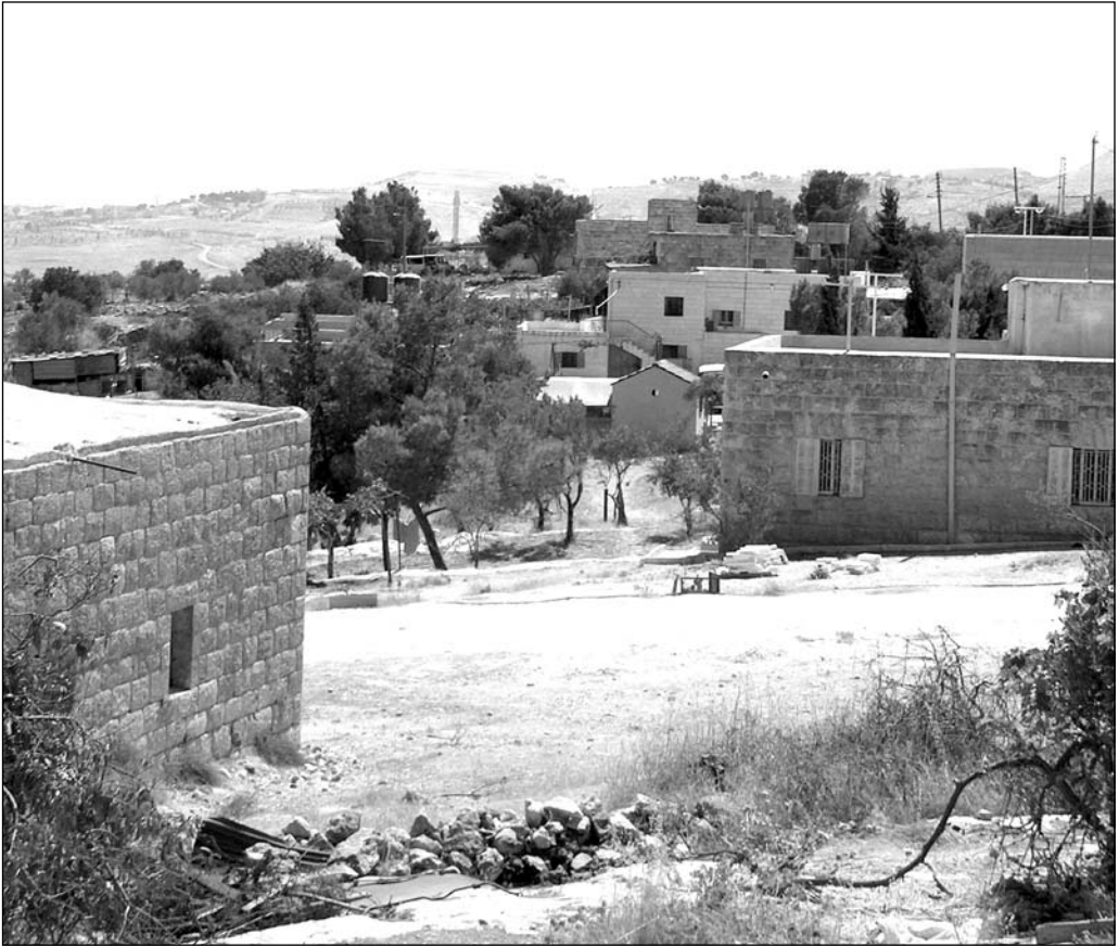
בתי נועמאן - ברקע: הכפר אל חי'אס