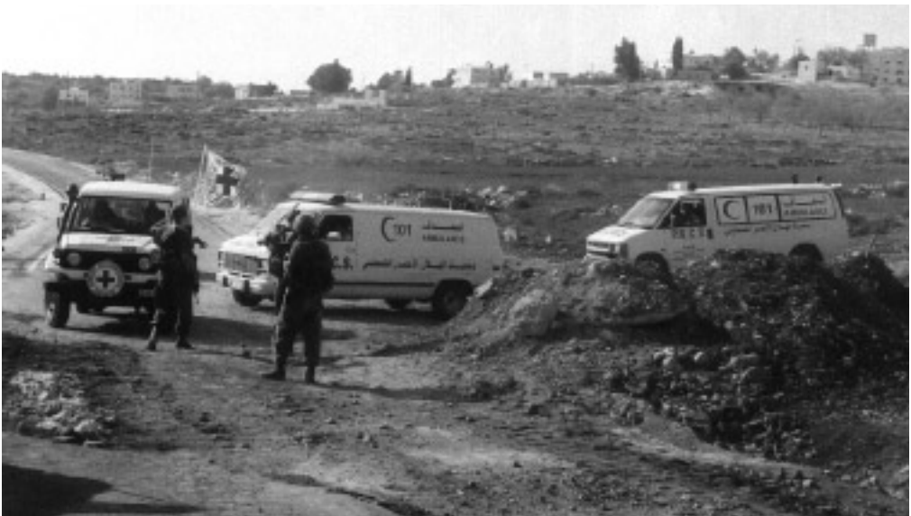
חיילי צה"ל מונעים מאמבולנסים להכנס לבית רימא, ציפיוס, ג'יהאד תחלה

במהלך הפשיטה בבית רימא, הוטל עוצר על הכפר על מנת לאפשר לכוחות צה"ל לפעול בביטחון. בשל כך לא התאפשר תחילה מעברם של צוותי ה"סהר האדום", אולם הפצועים הפלסטינים טופלו בשטח במסירות ע"י כוחות צה"ל ועל ידי רופאים מקומיים, וחלקם פונו בהתאם למצבם לקבלת טיפול רפואי בבית חולים בישראל. מיד כשהתאפשר, הוכנסו צוותי ה"סהר האדום" לכפר, וטיפלו בפצועים. 11