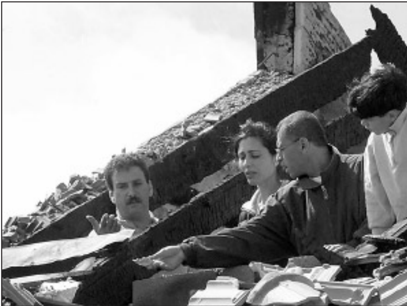
בית שפנע מירי צה"ל, צילום: נאيف השלמון, הוייטס

ביום ראשון, 6.5.01, בסביבות השעה 07:00, התמקמו שישה אנשי פת"ח חמושים על גבעה הנמצאת בין המחסום של מנגנון הביטחון הלאומי הפלסטיני בכניסה הדרומית לבית ג'אלא לבין בית הספר טליתא-קומי. הם פתחו באש על החיילים המוצבים במחסום צה"ל בכביש המנהרות ועל מגדל התצפית שהקים צה"ל כמה מטרים מול אותו בית ספר (ראו סימון המקומות המוזכרים בדו"ח זה בתצלום האוויר של האזור). לפי מידע שהגיע לבצלם, בין אנשי הפת"ח שפתחו באש על מחסום צה"ל היה ילד בן 14. באותו בוקר לא היה ירי מבית ג'אלא על בתי אזרחים ישראלים בגילה.