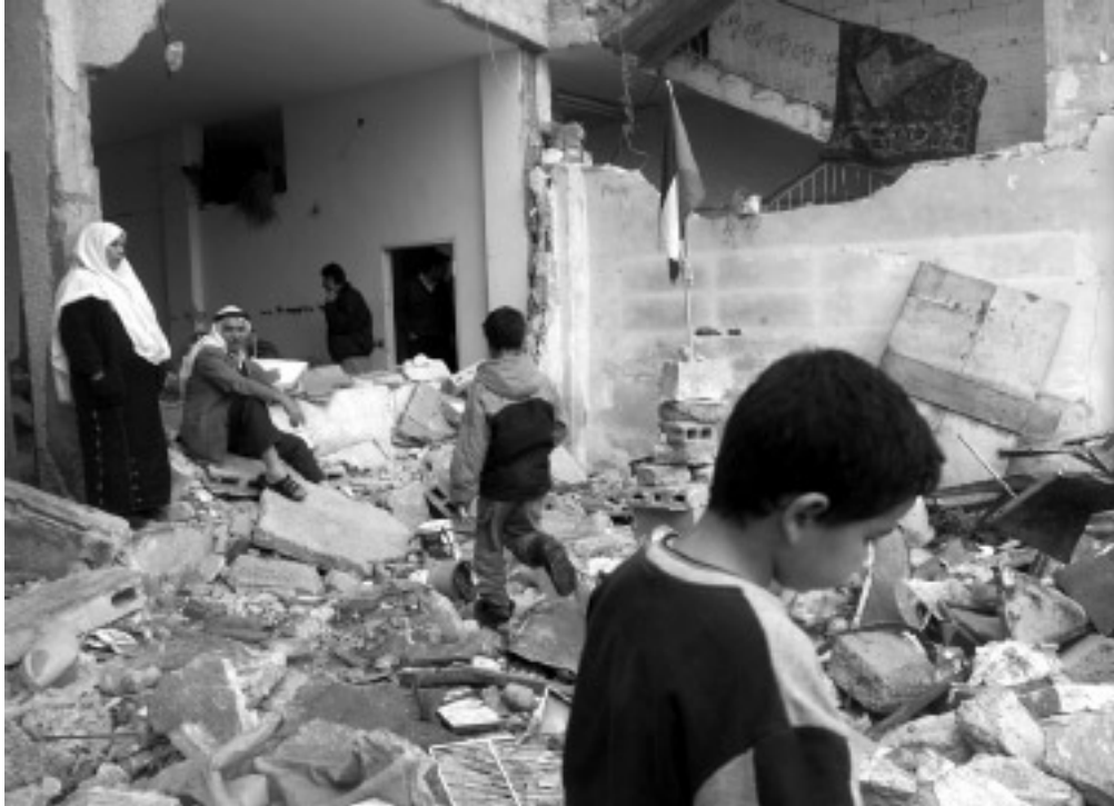
חניית שנחרסו על-ידי צה"ל מול טארידיס

אני גר עם משפחתי בבניין בן ארבע קומות ובו שמונה דירות. בדירה מספר אחת, בקומת הקרקע, גרים הורי. ביתר הדירות גרים אחיי עם משפחותיהם ובדירה נוספת בבניין גרים דיירים בשכירות. הבניין שלנו גבוה באופן יחסי ומשקיף על בתי המחנה. הבניין ממוקם כ-400 מטרים